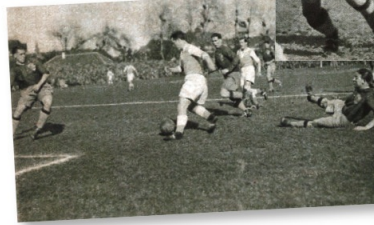
DUR DE LA LIGNE AU STADE DE LA MEINAU, LE RACING SUD-OCCIDENTAL DÉPUSÉ L'ÉQUIPE STRASBOURG D'UN STADE DE LA MEINAU PLEIN À BRÉPAGES. DUR DE LA LIGNE AU STADE DE LA MEINAU, LE RACING SUD-OCCIDENTAL DÉPUSÉ L'ÉQUIPE STRASBOURG D'UN STADE DE LA MEINAU PLEIN À BRÉPAGES. DUR DE LA LIGNE AU STADE DE LA MEINAU, LE RACING SUD-OCCIDENTAL DÉPUSÉ L'ÉQUIPE STRASBOURG D'UN STADE DE LA MEINAU PLEIN À BRÉPAGES.